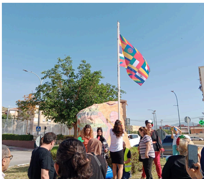
La bandera de las culturas de Palma Palmilla en la rotonda del Cuentacuentos, en avenida de La Palmilla.

En todo caso, es expresión del trabajo de decenas de personas y agentes de esta zona y ha sido revisado por la Mesa de Comunicación de este plan comunitario.